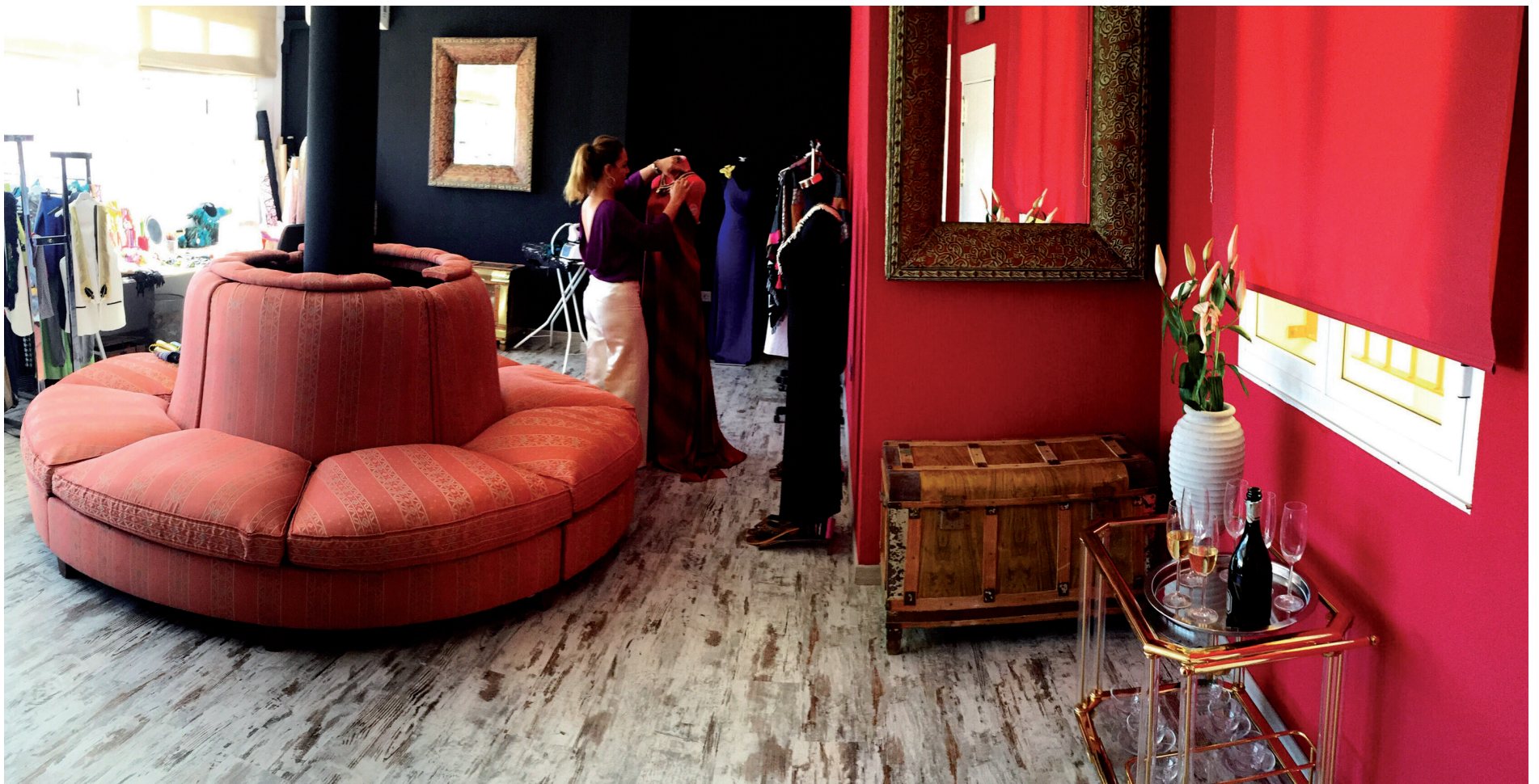
Las instalaciones del taller de diseño 'Carola', en el centro de Chiclaná, dan buena muestra del gusto y la originalidad de sus creaciones.